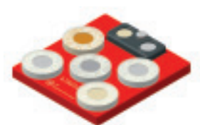
47A010 サンプルホルダー 5

導電率測定用標準試験片を収納する専用ホルダー3 (部品番号47A025) および5 (部品番号47A010) があります。