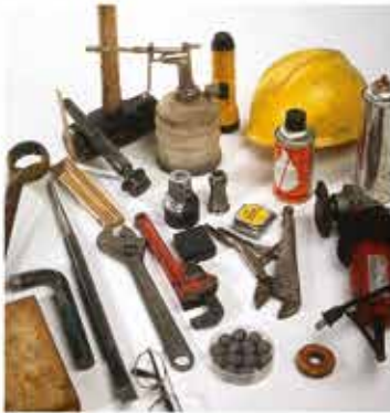
JAWS 2.0は様々な落下物を見つけ、回収することができます